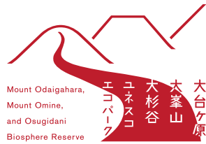
指定色以外の使用