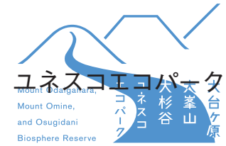
ロゴに他の文字を重ねない